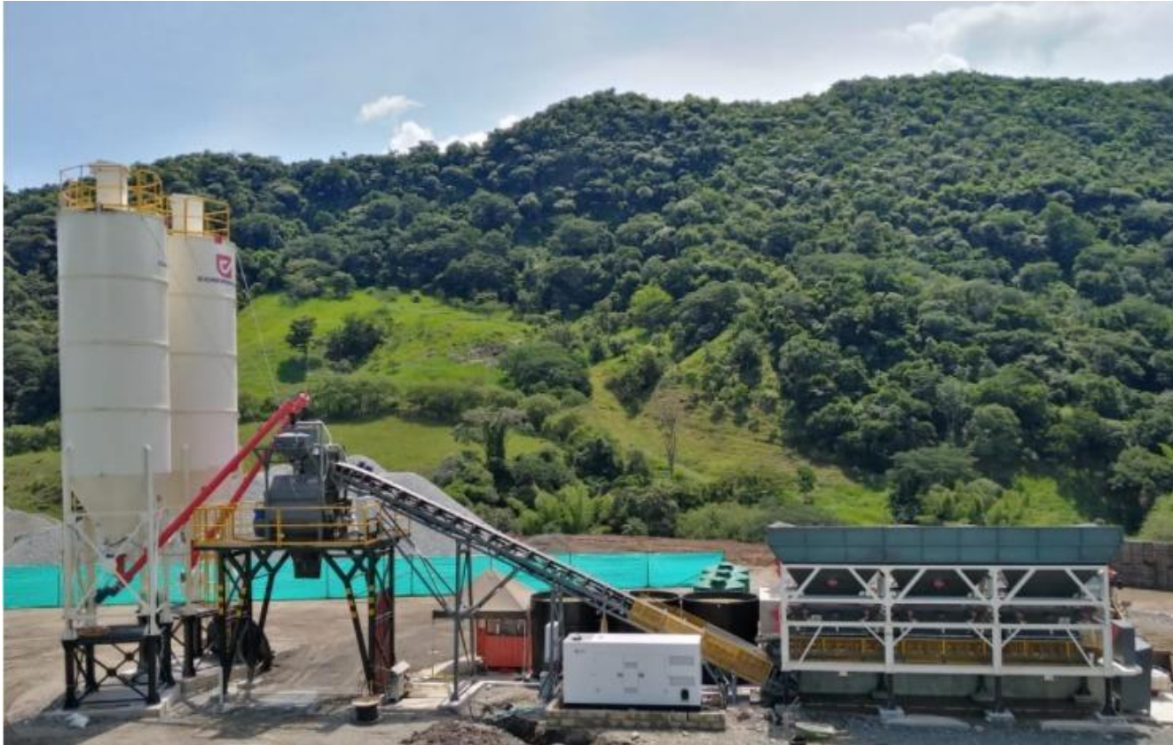
PLANTA DOSIFICADORA Y MEZCLADORA ALTRON AM-80SF 3A

Equipos con capacidad, desde 15 m 3 /H hasta 120 m 3 /H , con proceso de dosificación y mezclas controladas con un Software altamente confiable. Con mezcladoras de doblo eje Horizontal o de tipo planetarias según requerimiento del proyecto y del cliente. Cuentan Altura para descargue a camión mixer o a bomba de concreto